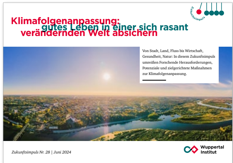
Titelseite des Zukunftsimpuls Nr. 28.

Das spiegelt sich auch im Zukunftsimpuls wider: Er richtet sich in erster Linie an politische Entscheidungsträger*innen, enthält aber auch Maßnahmen und Hinweise für Kommunen, Wirtschaft, Ehrenamtliche und zivilgesellschaftliche Organisationen. Am 4. Juli 2024 stellten die Autor*innen im Rahmen eines Wuppertal Lunchs außerdem die Inhalte des Papiers in Berlin vor. Die Teilnehmenden widmeten sich folgenden Fragen: Wie kann eine schnelle, effektive und sozial gerechte Klimaanpassung in der Stadt gelingen? Inwiefern lassen sich solche Extremwetterereignisse dem Klimawandel zuordnen? Und auf welche zukünftigen Folgen und Anpassungen müssen sich Städte und Länder vorbereiten? Auch über die Rolle technischer und naturbasierter Lösungen und soziale Innovationen wurde diskutiert. Zudem besprachen die Teilnehmenden, welche Handlungsoptionen der Politik, den Verwaltungen und der Gesellschaft offen sowie welche Barrieren und Zielkonflikte einer raschen Umsetzung von Klimaschutzkonzepten im Weg stehen. > zum Zukunftsimpuls > zum Wuppertal Lunch