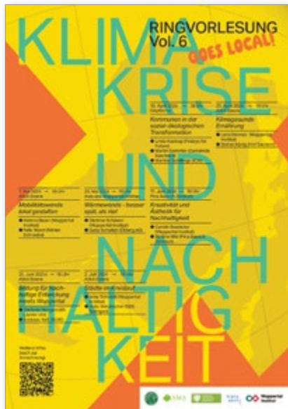
Poster zur Ringvorlesung „Klimakrise und Nachhaltigkeit“ im Sommersemester 2024.