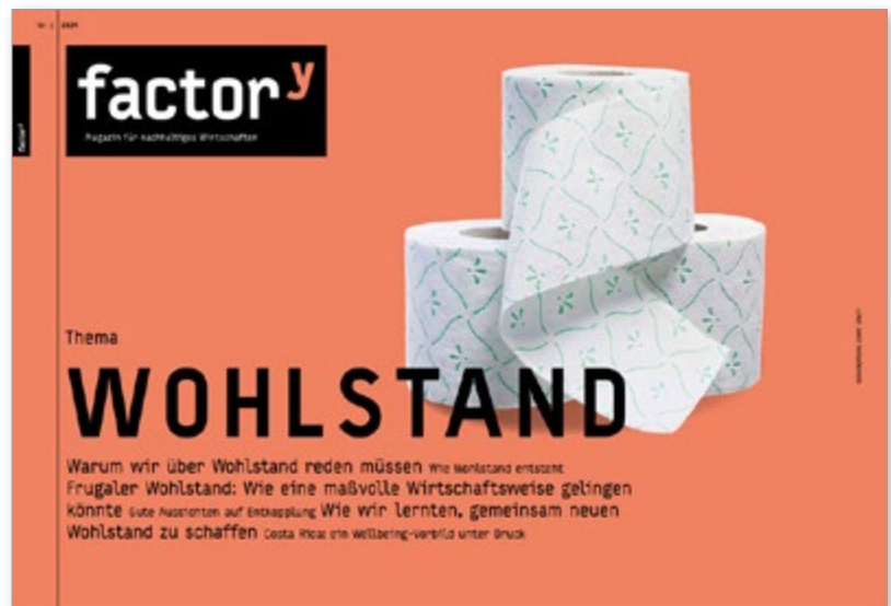
Cover des FactorY-Magazins „Wohlstand“.

Mit Wohlstand verbinden die meisten Menschen nahezu ausschließlich materiellen und persönlichen Wohlstand. Gesellschaftlicher Wohlstand – wie Gesundheit, Bildung, Mobilität, oder Teilhabemöglichkeiten wie Gleichheit, Recht, Mitbestimmung, Presse- und Kunstfreiheit sowie Sicherheit – fallen dagegen oftmals unter den Wohlfahrtsbegriff. Hinzu kommen die unterschiedlichen Ansichten über Wohlstand – insbesondere darüber, wie er erreicht und gesichert werden kann und was ihn gefährdet. Die Diskussionen konzentrieren sich dabei auf Fragen zur Sicherung der Lebensgrundlagen und darauf, wer Wohlstand garantieren sollte und welches Maß an Wohlstand ausreichend ist. Das aktuelle FactorY-Magazin „Wohlstand“ legt den Schwerpunkt vor diesem Hintergrund auf ein besseres Verständnis dieses Themas sowie eine ressourcenschonende Wirtschaftsweise, die Gewinne für alle erzielen kann. Zwar bedroht allein schon der Klimawandel Wohlstand, Menschenrechte und Freiheit, wie Studien und Gerichtsentscheidungen zeigen. Im Zusammenspiel mit