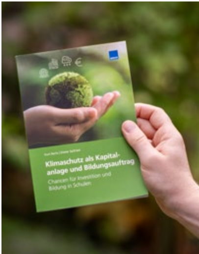
Das Praxishandbuch „Klimaschutz als Kapitalanlage und Bildungsauftrag“ ist im WEKA Media Verlag erschienen.