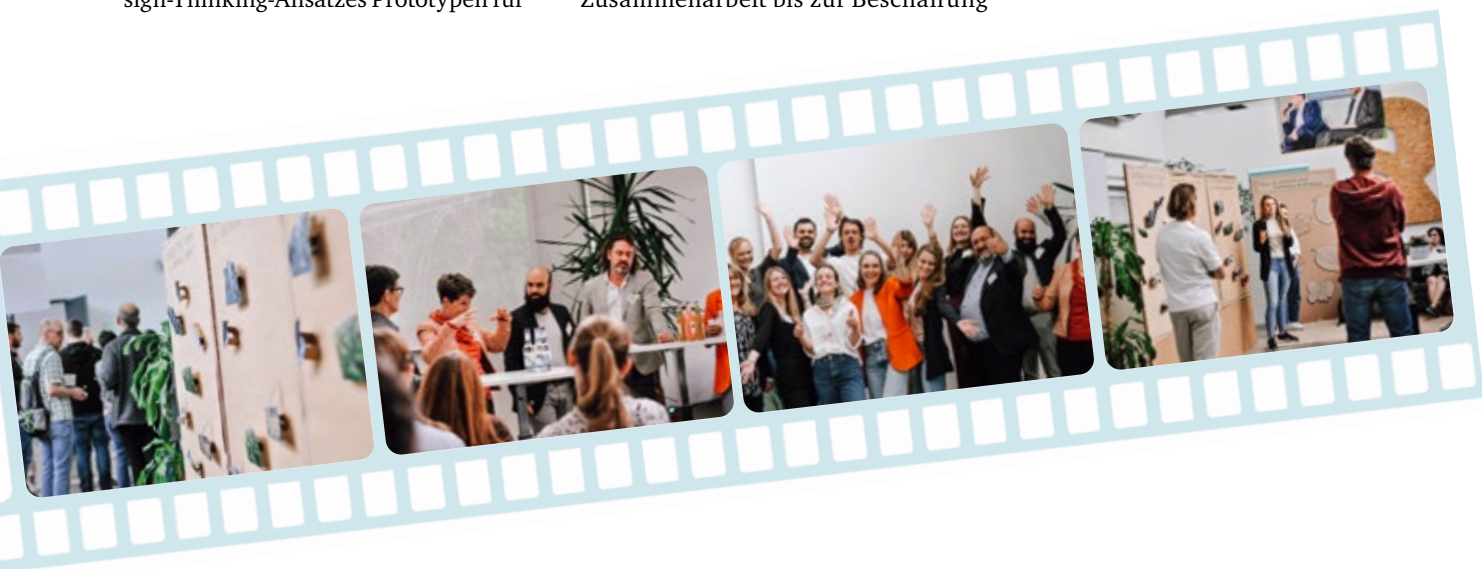
Impressionen der Abschlussveranstaltung des Projekts bergisch.circular.